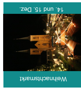
14. und 15. Dez.